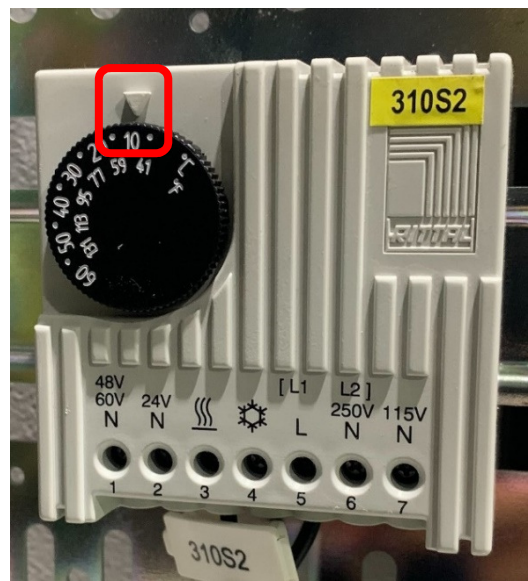
[스위치]: 적정 온도인 15도로 맞추기